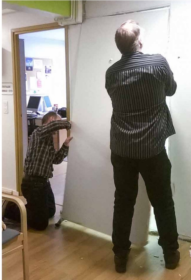
Järjestöuudistusta käytännössä, Oulun toimiston kaikki tilat otettiin MTK:n käyttöön ja tukittu väliovi aukaistiin jälleen.