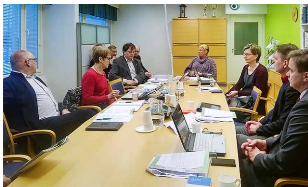
Aluekehitysvaliokunta koolla Oulussa

aluetta. Vuoden 2015 turnauksessa voiton vei MTK Oulaisen joukkue.