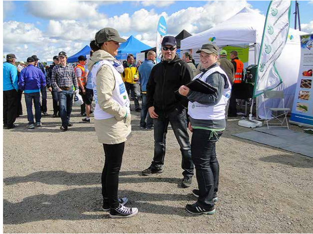
Nurmi 2015 tapahtumassa Ylivieskassa oltiin yhteisosastolla MTK Keski-Pohjanmaan kanssa