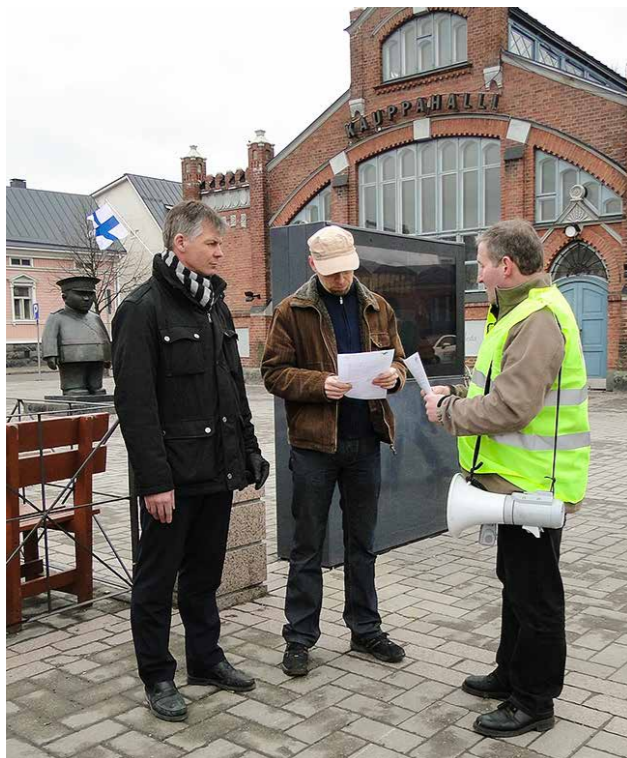
Puheenjohtaja luovutti kannanoton kaupan edustajille pyttipannu-tapahtumassa