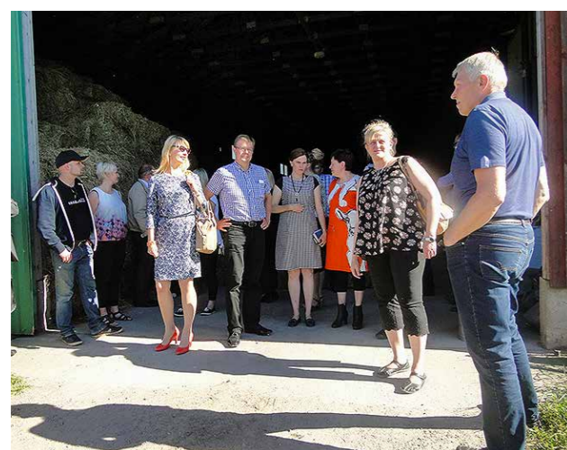
Kansanedustajat tutustuivat Lumijoella satonäkymiin.

Maaseudun kehittäjä- ja viranomaisorganisaatioiden yhteistyöelimenä Pohjois-Pohjanmaalla toimii maaseutuvuorokunta, jossa Pohjois-Pohjanmaan ELY:n, ProAgria Oulun, Suomen Metsäkeskuksen, Luken ja MTK Pohjois-Suomen edustajat keskustelevat luottamuksellisesti sektorin kehittämiseen vaikuttavista ajankohtaisista asioista.