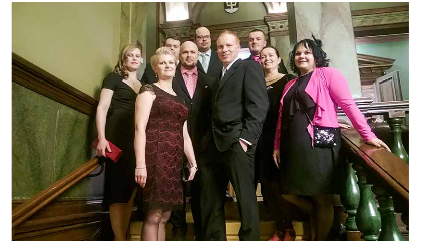
Komea joukko MTK Pohjois-Suomen edustajia nuorten syysparlamentissa Kuopiossa.

Todettiin, että MaaseutuHarava-hankkeen suunnitelma on muokattu nyt Kainuuta koskevaksi. Uusittu hakemus on