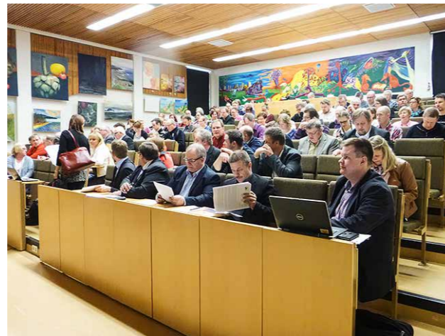
Liiton kevätkokous Limingassa.

Suomen maatalous elää tällä hetkellä yhtä lähistoriansa pahinta kannattavuuskriisiä. Tuottajahinnat kaikissa tuotantosuunnissa ovat huonot johtuen ennen kaikkea Venäjän asettaman EU:n elintarvikkeiden tuontikiellon aiheuttamasta maailman laajuisesta elintarvikkeiden kriisistä. Samaan aikaan suomalaiset viljelijät ovat käymässä uuteen tukiohjelmakautteen, jonka myötä tilatasolla tuet laskevat 10–20 % ja niiden maksatuksien aikataulu siirtyy entistä myöhäisemmäksi. Tuotantopanosten, kuten lannoitteiden, hinnat eivät ole laskeneet vaan päinvastoin nousseet viime vuodesta.