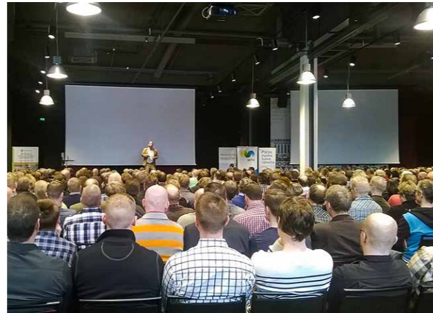
Metsäuudistuksen jälkeen Tampereen toimihenkilöpäivillä riitti väkeä.

Tässä tilanteessa vielä tukijärjestelmien hallintokin petti viljelijän. Jo alkuvuodesta oli tiedossa, että uuden tukioh-