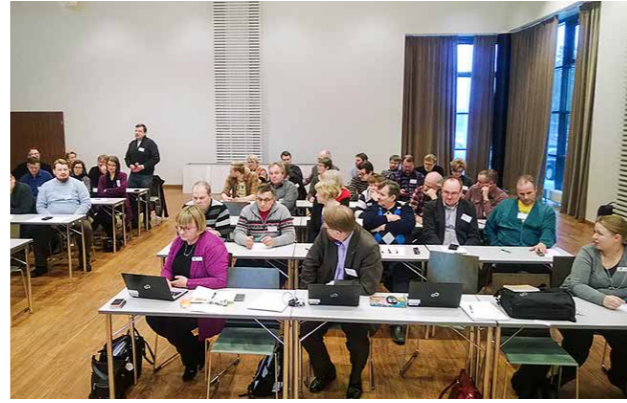
Neuvottelukunnan kokous Kalajoella

Porovaliokunta ei kokoontunut vuonna 2015, mutta porotalouden ja maatalouden yhteensovittamiseen liittyviä asioita vietiin yhdessä Lapin tuottajaliiton kanssa eteenpäin. Järjestettiin mm. tapaaminen maa- ja metsätalousministeriön porotaloudesta vastaavien virkamiesten ja osastopäällikkö Artjoen kanssa. Neuvottelua valmisteltiin yhdessä etukäteen, jonka pohjalta laadittiin ministeriölle luovutettu lausunto. Neuvottelussa ilmeni, että poronhoitolain uudistaminen