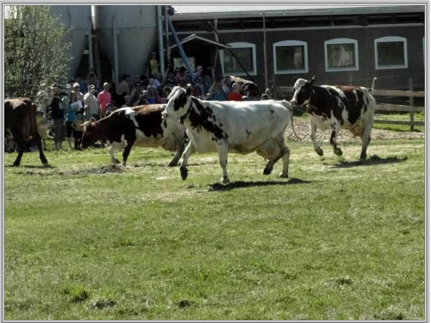
Kuva Heikkisen tilalta Kempeleestä, 18.5.2013 Laitumelle lasku – tilaisuudesta.