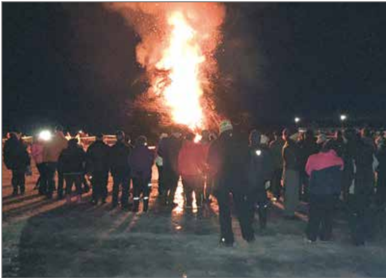
Pääsiäiskokko toteutettiin yhdessä ja sen ympärille kokoontui mukavasti väkeä.