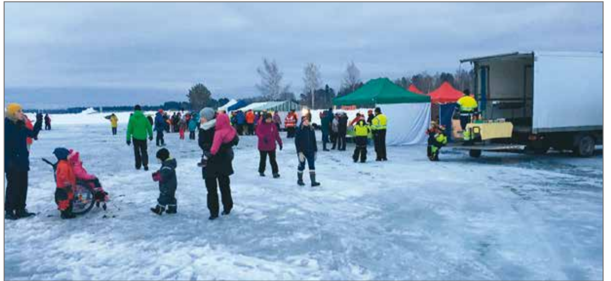
Myös yhteistä ulkoilupäivää vietettiin talvella.