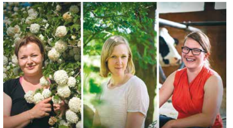
Kolme naista, kolme kärkisijaa.