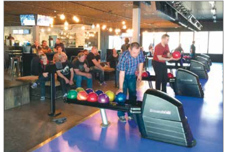
Keilauskuvaa on viime toukokuussa pidetystä haastekeilauksesta. Kajaani haastoi naapuriyhdistyksiä leikkimieliseen keilauskisaan. Joukkueita kisassa oli Kajaanista, Vuolijoelta, Sotkamosta ja Paltamosta.