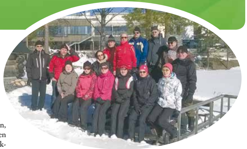
Kokoontumisajot Rokualla kevättalvella 2015.

Saksan opintomatalla ehdittiin pitämään myös jumppatuokio.