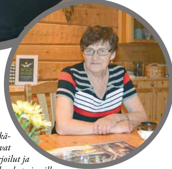
Sirkka-mummu on tuvan henki, jonka käsissä valmistuvat herkulliset tarjoilut ja lämpimät villasukat vieraille.

Huomionosoituksena tästä myönnetään yritykselle/henkilölle/henkilöille Vuoden kehittyvä maaseutumatkailuyritys -tunnustus. Valinnassa huomioidaan innovatiivisuus ja rohkea ote yrityksen kehittämiseen. Palkittava voi olla uusi yrittäjä, joka aloittaa tyhjältä pöydältä tai toimivan yrityksen jatkaja, joka on lähtenyt kehittämään yritystä selkeästi uusille urille. Palkinnolla halutaan kannustaa nimenomaan uutta yrittäjäsukupolvea ryhtymään maaseutumatkailuyrittäjiksi.