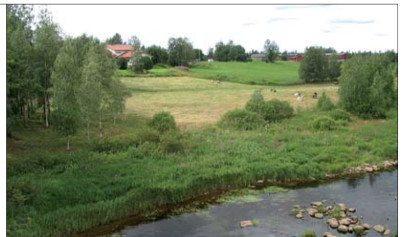
Hoidettua viljelymaisemaa suojaväyhykkeineen ja hakamisemineen Oulujokivarressa.

VIIME KEVÄÄNÄ julkistetut tulokset maatalouden ympäristötuen vaikutavuudesta vuosina 1995-2006 osoittivat,