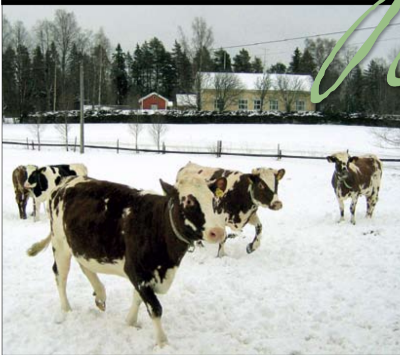
Pohjois-Pohjanmaa säilyttää ennusteiden mukaan vahvan asemansa maitomaakuntana.