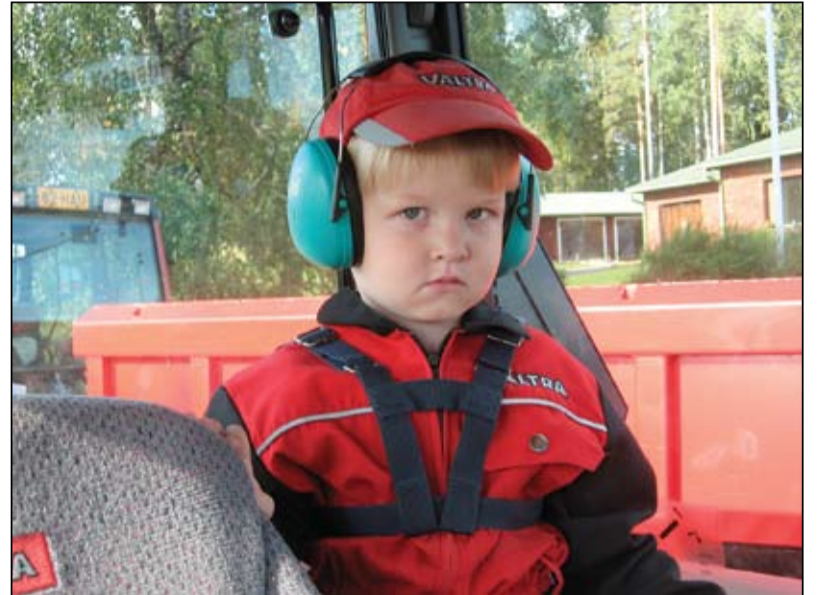
Lapselle turvallinen maatala on turvallinen myös aikuiselle.

VILJELIJÄ voi tehdä sairaanhoitosopimuksen ennaltaehkäisevän työterveyshuollon yhteyteen, jolloin työterveyslääkäri hoitaa myös muut kuin työperäiset sairaudet. Työterveyslääkärin läheteellä pääsee tarvittaessa erikoislääkärille. Sairaanhoidon kustannuksissa on korvaus, mutta noin kolmen lääkärikäynnin kustannuksista voi saada puolet