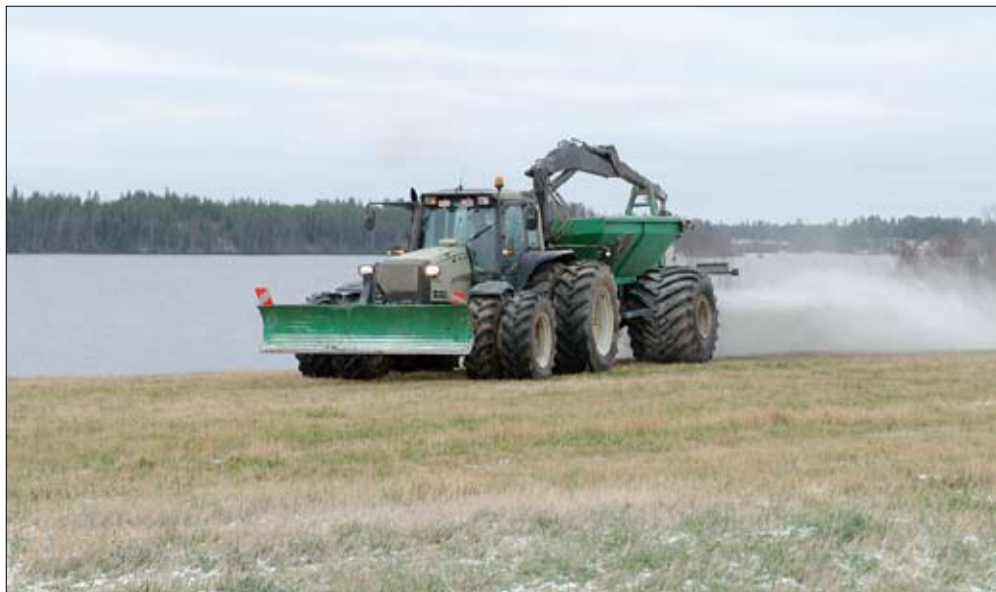
Talvi on parasta kalkin levityksen aikaa, sillä routainen maa kestää parhaiten painavat koneet. Kalkkia voi levittää muulloinkin, kunhan välttää märkien maiden tallaamista raskailla koneilla.