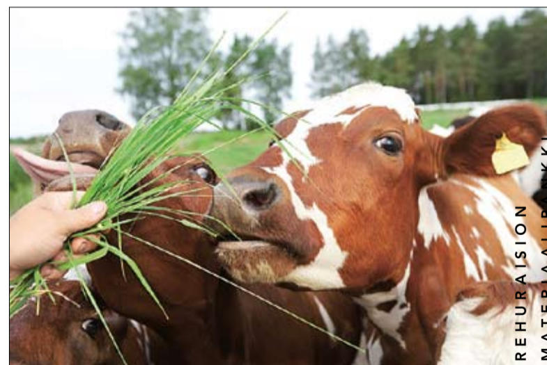
Viime kesän poikkeuksellisen lämpimän mutta vaihtelevan sään seurauksena kaikilla alueilla ei saatu riittävästi rehua talteen. Tilanne tarkentuu sisäruokintakauden edetessä.

sisäruokintakauden edetessä, mutta jo nyt tiedetään varmasti, että joillain aluilla tulee puutetta karkearehusta.