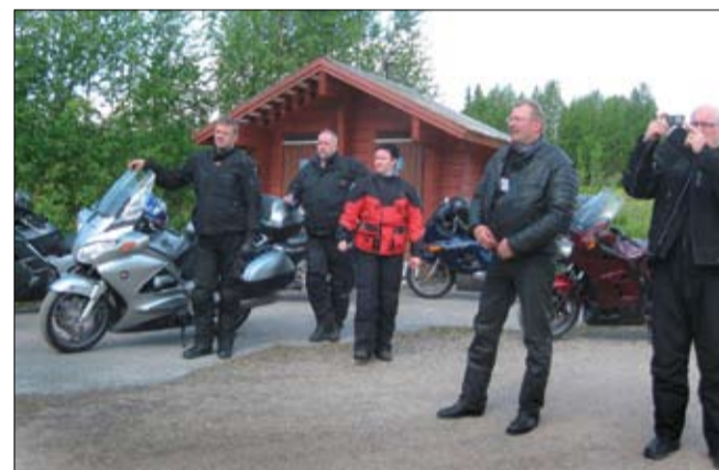
Tauolla Raatteen tien maisemissa.

Kokoontumisen yhteydessä kerho piti kokouksen, jossa laadittiin muun muassa säännöt ja