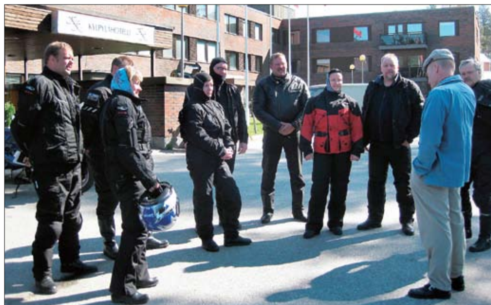
MP Farmarit lähtötunnelmissa kylpylä-hotelli Kiannon Kuohuista.