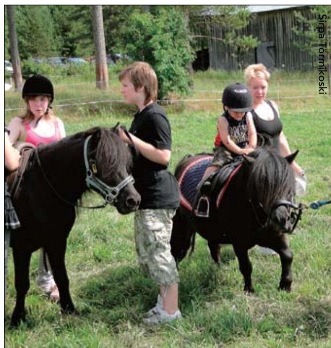
Poniratsastuksella riitti kysyntää.

ja ongintaa. Lapsilla oli mahdollisuus ajella polkutraktoriradalla ja käydä ratsastamassa ponilla.