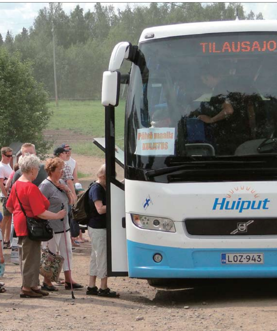
Oulun keskustan ja Lambergin maitotilan väliä liikennöineet kaksi linja-autoa kulkivat täysissä lasteissa.