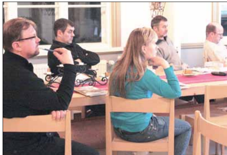
Voimaras-hanke on järjestänyt muun muassa tietoiskuja energiansäästöä, bioenergiasta ja lämpöpumpuista. Huhtikuun opintomatalla Saksaan ja Itävaltaan tutustumiskohteina on paikallisten yritysten ja maatilojen vaihtoehtoisia energiaratkaisuja.

- Ajatus pitää edelleen paikkansa. Kasvava tilakoko koettelee viljelijän jaksamista, mutta yhtä tärkeää on pitää kaikenkokoiset tilat elävinä tulevaisuuden varalta. Suurhankkeet merkitsevät maanomistajien etujen valvontaa. Jonkun on myös puolustettava suomalaisen ruuan tuottamista.