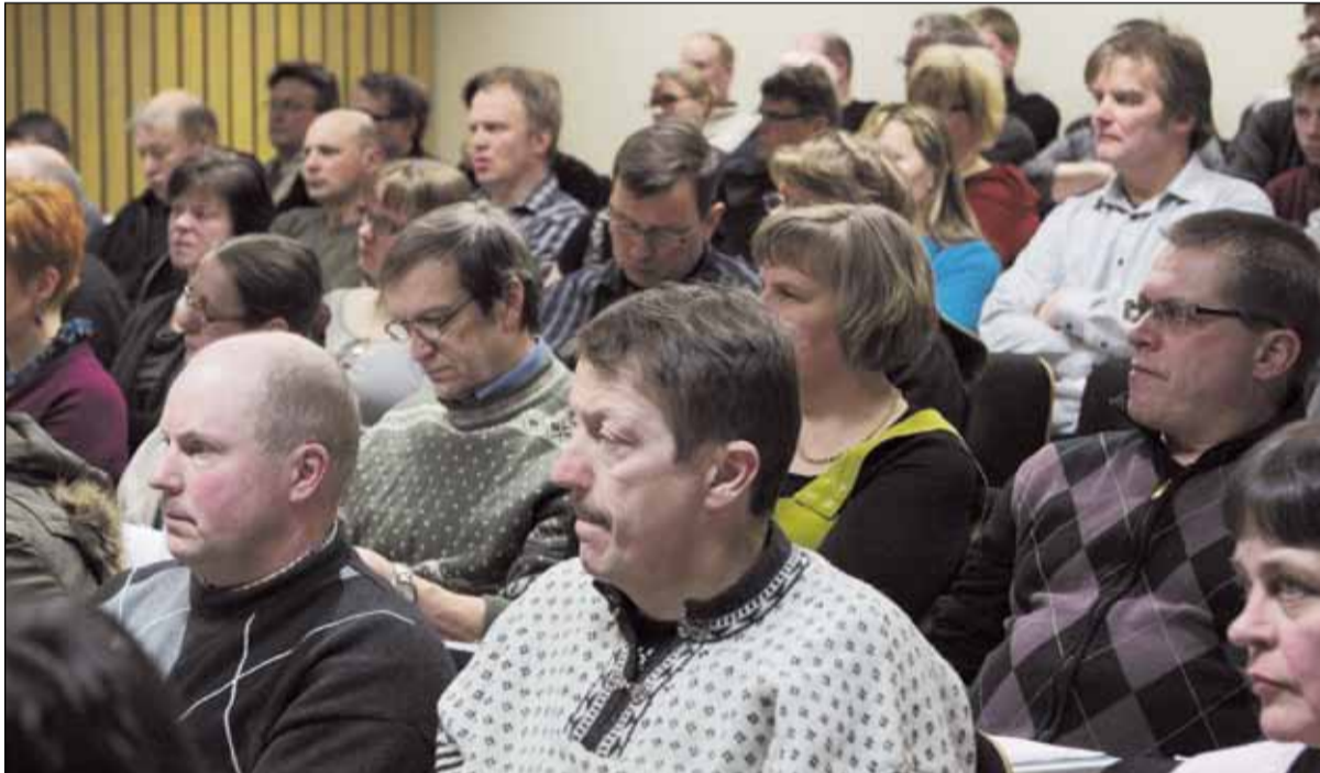
Rokuan luomupäiville osallistui 60 luomutuottajaa tai tuotannosta kiinnostunutta.

Oravat ovat tyytyväisiä itsensä kokoiseen perheytyykseen. Neljä lasta ovat mukana sekä maitotilan että sen ohessa toimivan metsäkoneyrityksen töissä.