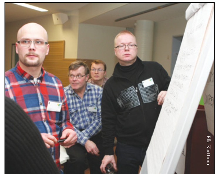
Yhdistysten vuoden aloitus-tilaisuuden ryhmätöissä Oulun Edenissä pohdittiin muun muassa tuottaja- ja metsänhoitoyhdistysten yhteistyötä.