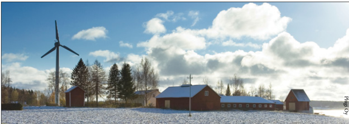
Maanomistajan kannattaa osallistua tuulivoimalahankkeisiin alusta lähtien ja olla mukana maankäytön suunnittelussa.