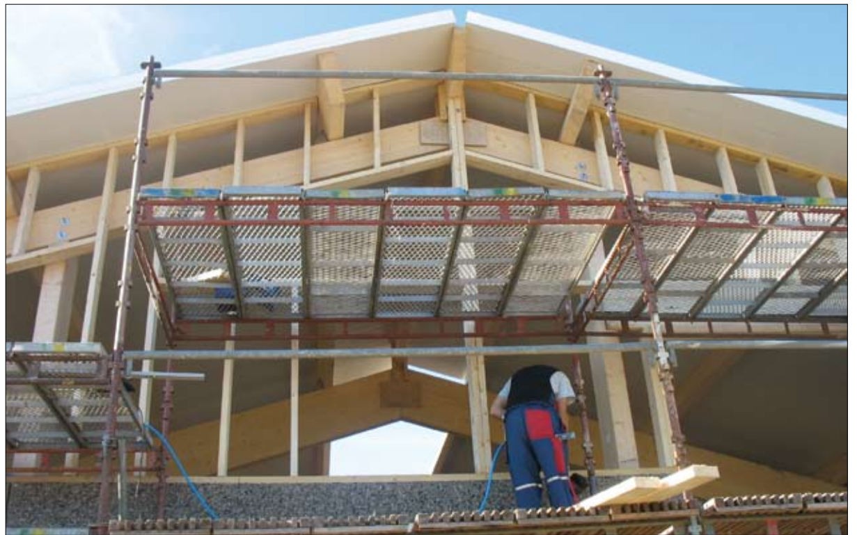
Ympäristö- ja rakennuslupa ovat rinnakkaisia lupia. Rakentamisen saa pääsäännön mukaan aloittaa vasta sitten, kun ympäristölupa on lainvoimainen. Ympäristölupahakemus kannattaakin laittaa vireille hyvissä ajoin.