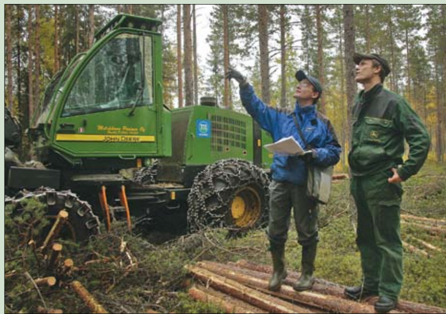
Tekemisen meininkiä metsässä. Metsäliiton alueurakoitsija Metsäkone Pirisen hakkuukoneelle on töitä riittänyt. Harvennusemissä kuljettajalta vaaditaan erityistä ammattitaitoa, jotta parhaat puut jäävät kasvamaan tukkikokoon.