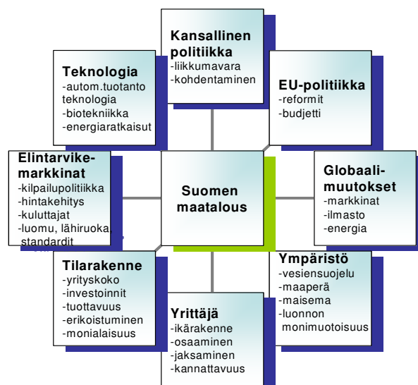
Kuva 1. Maatalouteen vaikuttavat eri tekijät.

Maatalouden perustehtävänä on ravinnon tuottaminen. Elintarvikkeiden saataavuus, laatu ja hinta vaikuttavat jokaisen maapallon asukkaan päivittäiseen elämään ja toimeentuloon. Kansallisen maatalouspolitiikan ja suojattujen markkinoiden ajasta on siirrytty yhteiseen maatalouspolitiikkaan ja sisämarkkinoihin. Maataloustuotanto on lisäksi monella muullakin tavalla kytkeytynyt koko yhteiskunnan toimintaan. Tämän takia maatalous ja maatalouspolitiikka vaikuttavat kaikkiin kansalaisiin ja kiinnostavat monia eri tahoja. Tähän maatalouden monivaikutteisuuteen on viime vuosina kiinnitetty entistä enemmän huomiota sekä kehittyneiden että kehitysmaiden taholta.