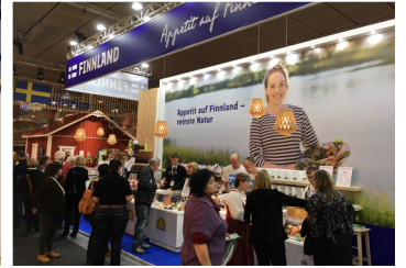
Kuvat Suomen Grüne Woche -osastoilta vuosina 2016 ja 2018.

Suomi on pääyhteistyökumppani 18.-27.1.2019 Berliinissä pidettävillä maailman suurimmilla ruoka-alan kuluttajamessuilla . Suomalainen puhdas arktinen ruoka puhtaasta luonnosta, kestävä suomalainen metsätalous, vihreän talouden puutuotteet ja Suomi rentouttavana elämys- ja luontomatkailumaana saavat erityistä näkyvyyttä vuoden 2019 messuilla.