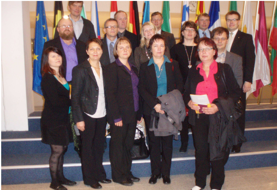
Kuva 1 Opintomatkalaiset Euroopan Parlamentin aulassa