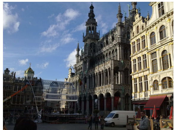
Kuvat 4, 5, 6 ja 7 Atomium –monumentti, Manneken Pis ja Grand-Placea ympäröiviä rakennuksia