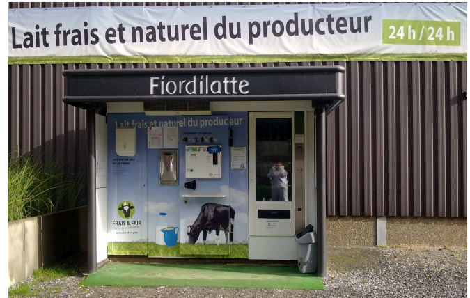
Kuvat 8 ja 9 Ryhmämme tutustuu Ferme Pussemier tilan toimintaan ja maidon suoramyyniautomaatti