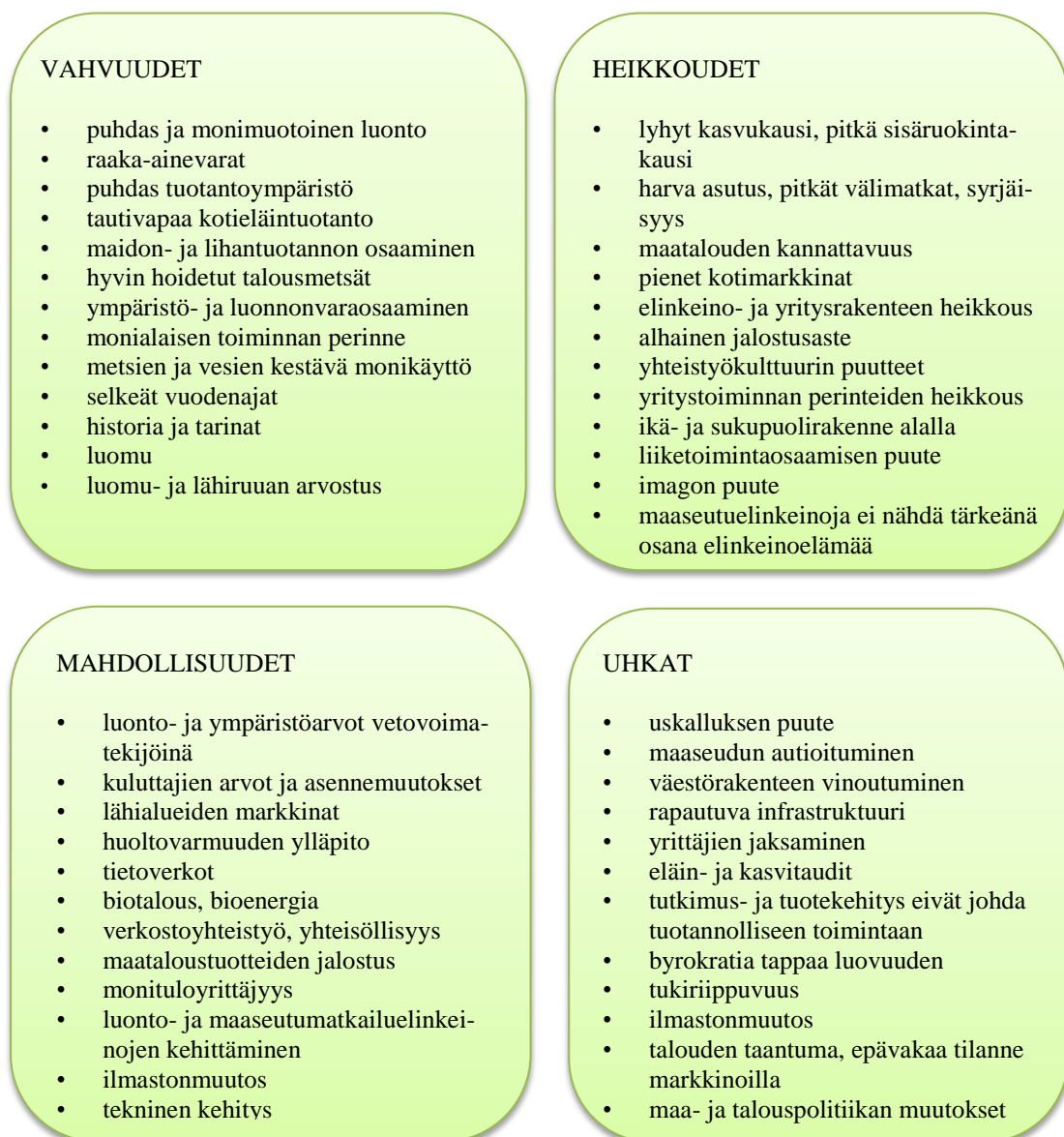
Kuvio 3. Kainuun maa- ja elintarviketalouden nelikenttäanalyysi.

Analyysissä (kuvio 3) on huomioitu sekä aiemmin nelikenttäanalyysissä mukana olleita maa- ja elintarviketalouteen vaikuttavia tekijöitä että uusia, toimintakentän muutoksesta aiheutuneita tekijöitä.