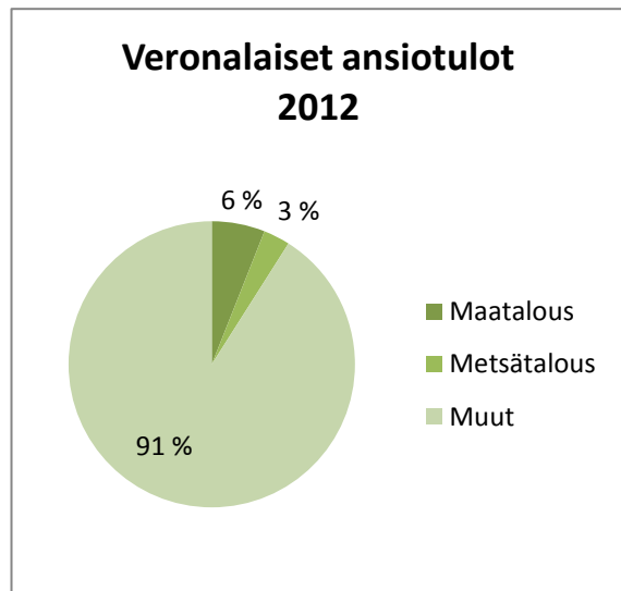
Kuvio 1. Maa- ja metsätaloudesta kertyvät ansiotulot 2012 Kainuussa

Tällä hetkellä Kainuun ELY-keskuksen alueen työvoimasta 9 % saa tulonsa alkutuotannosta, mutta lukua olisi mahdollista kasvattaa tulevaisuudessa (kuvio 1).