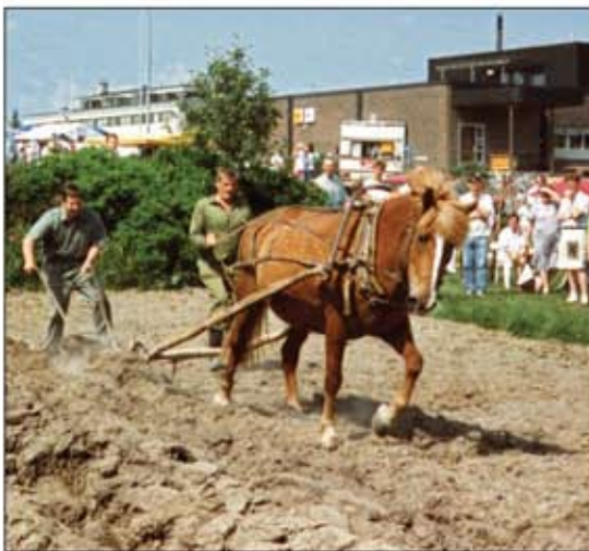
Muuramen markkinoilla 1980-luvulta