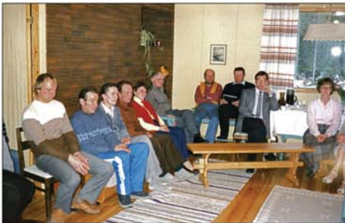
Tuottajaillat olivat 70-80 luvun perinne