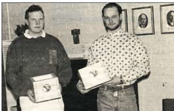
Kappojen jako on vähintään 50 v. säilynyt perinne SPV:n yhteydessä