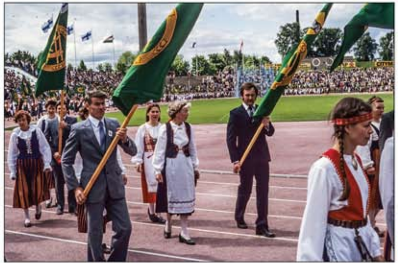
MTK:n 25. liittouhla 5.6.1982 Tampereella

Vuonna 1977 vietettiin Alkio-opistolla yhdistyksen 60-vuotisjuhlaa. Sattumalta osanottajia oli täsmälleen saman verran kuin perustamiskokouksessa eli 155 henkilöä. Samana vuonna 15.11.1977 Maataloustuottajain Korpilahden yhdistyksen lippu siunattiin käyttöön.