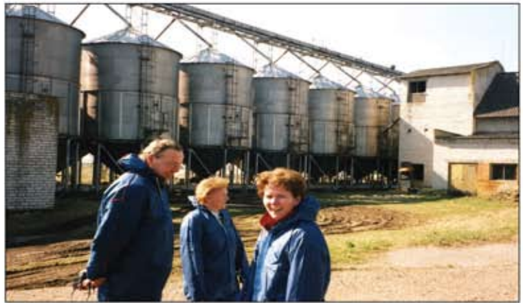
Yhdistyksen opintomatka Viroon